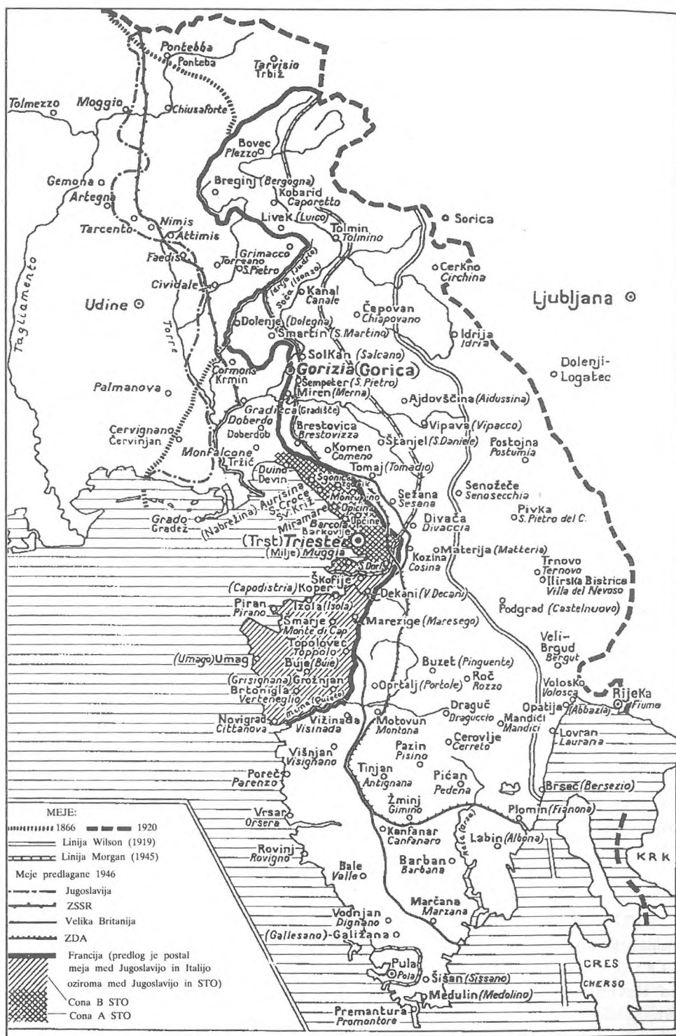
Zemljevid Julijske krajine z vrisanimi mejami in mejnimi predlogi 1945-1954.