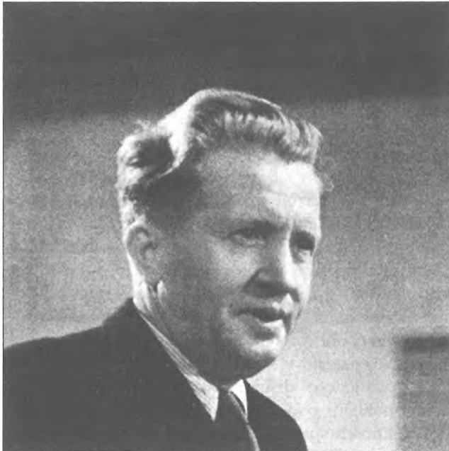
Miha Marinko (1900-1983), dolgoletni voditelj slovenske Partije 1946-1966, od leta 1953 predsednik SZDLS, predsednik slovenske vlade od 1946 do 1953, predsednik Ljudske skupščine LRS od 1953 do 1962, republiški in zvezni poslanec, od leta 1958 tudi član Izvršnega komiteja CK ZKJ.

Josip Broz in organizacijski sekretar Aleksander Ranković, demokratizaciji pa so bili bolj naklonjeni Milovan Djilas ter politično previdnejša Vladimir Bakarić in Edvard Kardelj. Precej "konzervativcev" je bilo v republiških partijskih vodstvih, zlasti v srbskem in črnogorskem. Tudi v slovenskem izvršnem komiteju, ki ga je vodil po Djilasovi oceni konzervativni Miha Marinko, vidnejših zagovornikov demokratizacije ni bilo, čeprav sta bila med njegovimi člani kasnejša reformista Boris Kraigher in Stane Kavčič.