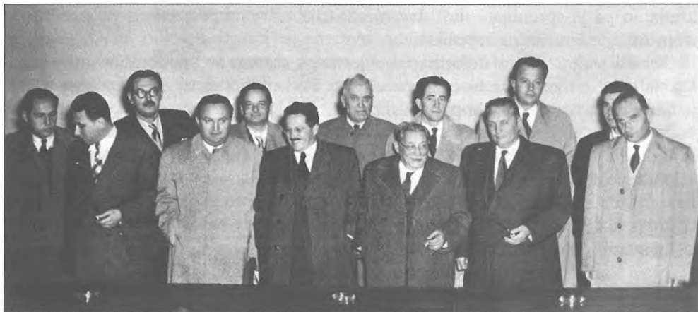
Jugoslovanski partijski vrh izvoljen na VI. kongresu ZKJ 1952 v Zagrebu. Od leve proti desni stojijo Ivan Gošnjak, Aleksandar Ranković, Franc Leskošek, Vladimir Bakarić, Boris Kidrič, Edvard Kardelj, Djuro Salaj, Moša Pijade, Milovan Djilas, Josip Broz, Svetozar Vukmanović, Lazar Koliševski, Djuro Pucar.

petdesetih let ni bilo ustreznih materialnih pogojev, verjetno pa tudi ne resnične pripravljenosti za prerazporeditev politične moči, kar so nekateri voditelji kasneje celo priznavali.