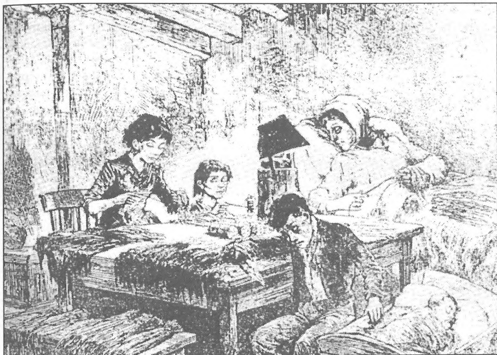
Delo otrok je bilo v 19. stoletju običajno. Otroci so delali ponoči ob soju petrolejk.

Drugi socialni problem, ki so ga poskušali rešiti z reformami, je bilo delavsko vprašanje. Delavcem so kot korenček ponudili obsežno socialno zakonodajo, s katero se je takratna Avstrija uvrstila ob bok državam z najboljšo socialno zakonodajo. Vendar s to zakonodajo niso bili zaščiteni prav vsi delavci, temveč le obstoječemu družbenemu redu najbolj nevarni industrijski delavci. Zaradi lastnih interesov so konservativni obrtniki, kmetje in veleposestniki iz nje izključili obrtne in kmetijske delavce, čeprav je bil njihov socialni položaj praviloma še veliko slabši kot položaj tovarniških delavcev.