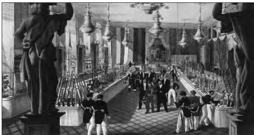
Cesar Ferdinand si ogleduje razstavne predmete v Reduti

(Denkbuch der Anwesenheit Ihrer k. k. Majestäten Ferdinand I. und Maria Anna in Krain und Kärnten im September 1844, Narodni muzej Slovenije, Grafični kabinet)