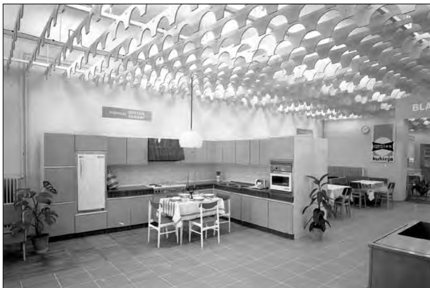
Marlesova kuhinja Cocktail variant, slikana v Kranju, avgusta 1972.