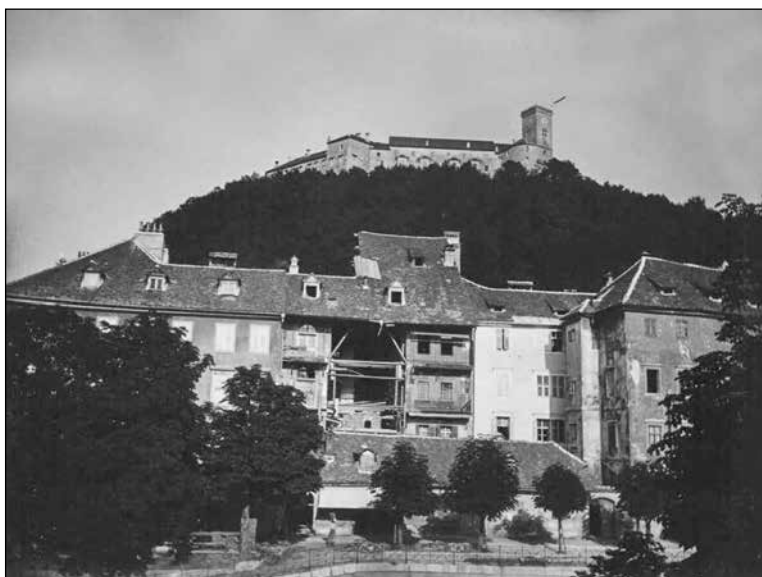
Francevo nabrežje (današnje Cankarjevo) in zadaj Ljubljanski grad

Na pomoč so ponesrečenim v potresu prišle vse tri oblasti, občinska, deželna in državna. Sprva se je največ energije vložilo v direktno pomoč ponesrečenim v potresu – od zasilnih nastanitev, hrane, vode do denarne pomoči. Kmalu po potresu pa so se začele voditi bolj dolgoročne politike. Za vzor je bila večkrat postavljena modernizacija Zagreba 451 po potresu leta 1880. Že na prvi popotresni seji mestnega sveta se je predlagalo, da se prosi državne oblasti za brezobrestno posojilo, da bi se kot Zagreb lahko modernizirala tudi Ljubljana. 452