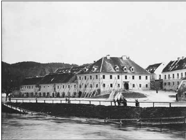
Narasla Ljubljana pri današnjem Ambroževem trgu

Naslednja noč je bila zelo hladna, Frančišek Lampe piše, da je bilo »slane kakor bi bil zapadel sneg.« 368 Nekaj dni kasneje pa je začelo še deževati. Šotori so bili premočeni in prehladni za bivanje. Ljudem, ki so morali ostati v šotorih, se je razdeljevala slama, hitelo pa se je tudi z gradnjo barak. 369 Poleg že omenjenega zneska, ki ga je za gradnjo odobril občinski svet, je 25. aprila dežela občini odobrila 25.000 goldinarjev za isti namen. 370 Kljub temu so, ko je sredi maja ponovno začelo snežiti, v časopisju kritizirali prepočasno gradnjo barak, saj so nekateri še vedno živeli v šotorih. 371