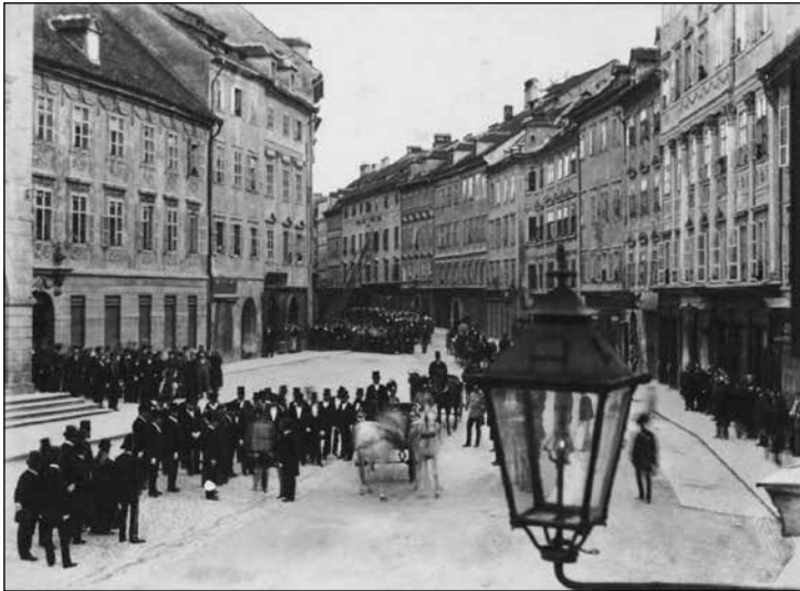
Cesarjev obisk v Ljubljani