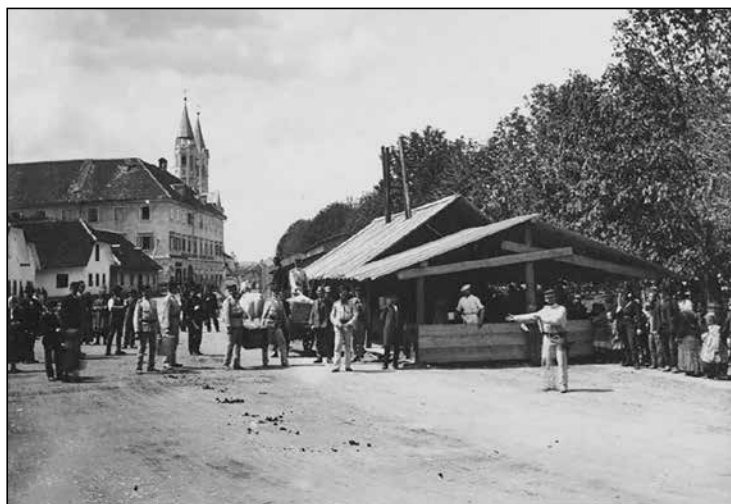
Kuhinja za silo