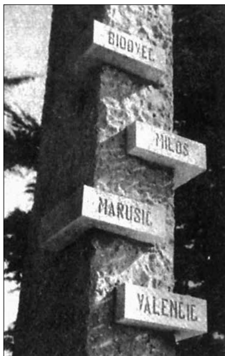
Spomenik bazoviškim žrtvam, pogost motiv v slovenskih zgodovinskih učbenikih

(Gabrič, Režek, Zgodovina 4 , str. 220.)