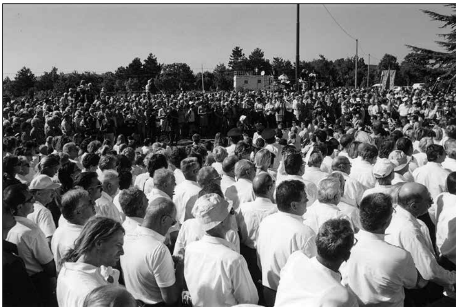
Velika spominska slovesnost v Bazovici 10. septembra 2000, ob 70-letnici usmrtnice štirih bazoviških junakov