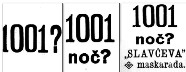
Slovenski narod , 9.–18. januar 1905.

Tiskana površina oglasnika se, resnici na ljubo, ni zvišala le zaradi porasta inseratov, spremenila se jim je tudi oblika, bili so večji, tudi celostranski, in vsebovali več ilustracij. Prenasičenost z oglasi je namreč prisilila oglaševalce, da so bili ti vedno bolj inovativni, morali so biti izstopajoči in opazni.