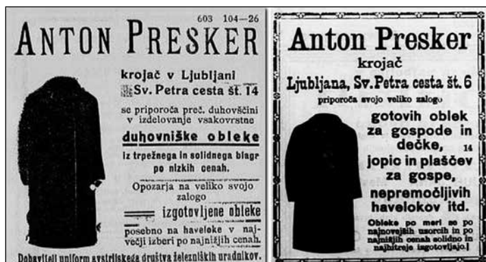
Slovenec , 28. februar 1905 in Slovenski narod , 4. februar 1905.

Bolj kot politični oglasi so tako zanimive razlike v oglaševanju. A če v zgodbo o oglasih vpletemo politiko, se hitro znajdemo na spolzkem terenu. S samo primerjavo med časopisoma je težko določiti, ali so razlike posledica ideologije ali česa drugega. 232 Kar pa ne pomeni, da politična usmeritev časopisa ni vplivala na oglaševanje. Slednje je bolj opazno pri samih oglaševalcih, saj so nekateri inserirali izključno v enem izmed časopisov. Največ takšnih primerov je pri t. i. malih oglasih, ženitnih ponudbah in drugih naznanilih (drugače od osmrtnic, ki so večinoma objavljene v obeh časopisih). Kar ne preseneča, saj posamezniki večinoma oglašujejo v časopisu, ki ga sami berejo.