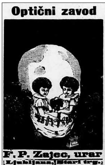
Slovenski narod , 4. marec 1905.