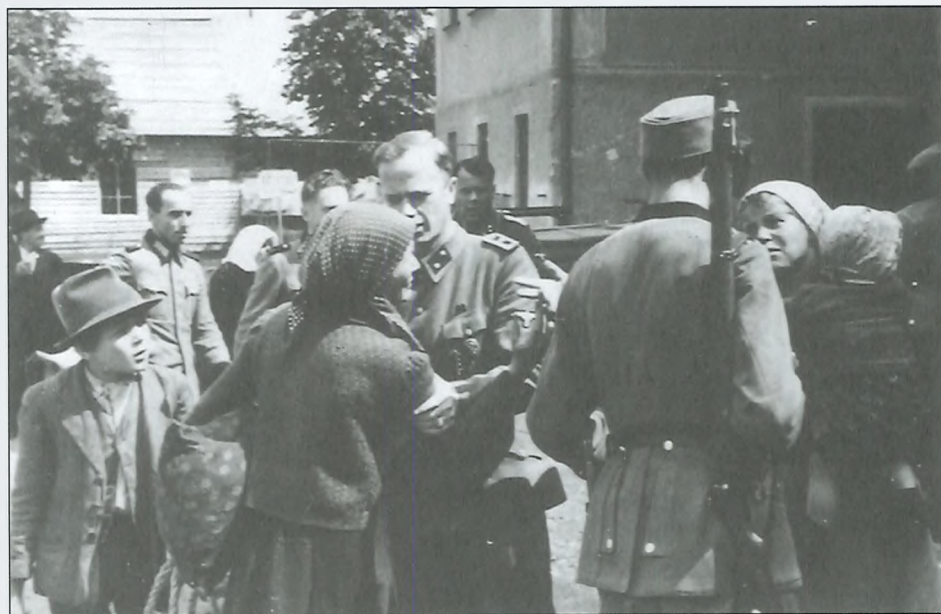
Ločitev mater od otrok, avgust 1942.