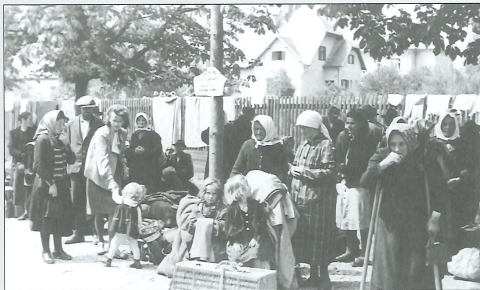
Matere z otroki na dvorišču okoliške šole v Celju, avgust 1942.