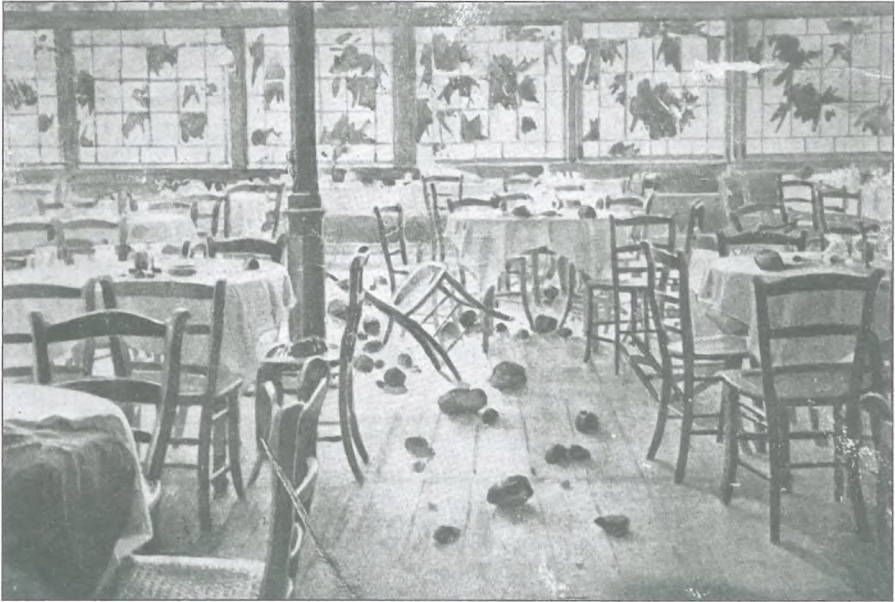
Kazinska restavracija po protinemških demonstracijah septembra 1908

Kazina je postala med slovenskimi nacionalisti tako osovražena, da jo je lahko skupila tudi takrat, ko protesti sploh niso bile naperjeni proti Nemcem. Pomladne demonstracije leta 1903 na Hrvaškem so v slovenskih deželah izzvale pravo solidarnostno gibanje. 19. maja 1903 je slovenska politika družno organizirala protestni shod v podporo Hrvatom in proti madžaronskemu banu Khuenu – Héderváryu. Po končanem shodu v mestnem domu pa je protimadžarska manifestacija dobila nenavaden obrat. Pred Kazino je shod mutiral v veliko protinemško demonstracijo, ki so jo oblasti zatrle šele s pomočjo orožništva in vojaštva. Množica je v parku Zvezda demonstrativno zapela »Hej, Slovani«, nakar je med ljudmi zavrelo, »začelo se je kričanje, letelo je kamenje, počila naj bi tudi dva strela, ki da sta priletela v okno Kazine.« Množica je hotela naskočiti kazinsko kavarno, a jo je policija razgnala. Kasneje se je izkazalo, da ni šlo za strele, ampak za projekte izvrstne frače, ki jo je lastnik »uporabljal za streljanje žab na Barju«. Demonstranti so trdili, da so na njih iz Kazine metali neke stvari in jih polivali z vodo, kar so »kazinoti« odločno zanikali. Že 7. junija 1903 so se izgredi pred Kazino ponovili, ko so ljubljanski turnarji v stavbi praznovali štiridesetletnico društva. Navkljub pozivom v časopisih, naj na nemške provokacije ne nasedajo, se je tudi tokrat na vogalu parka začelo zbirati večje število ljudi. Na kazinskem