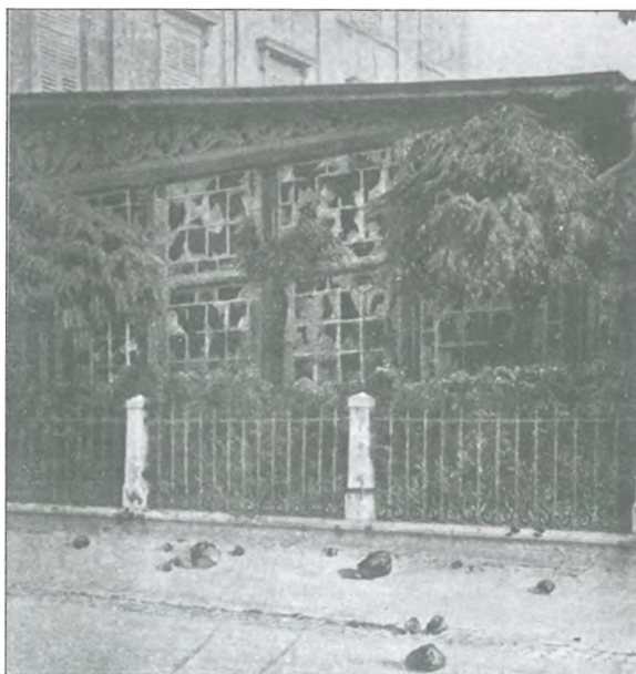
Kazinska zastekljena veranda po protinemških demonstracijah septembra 1908