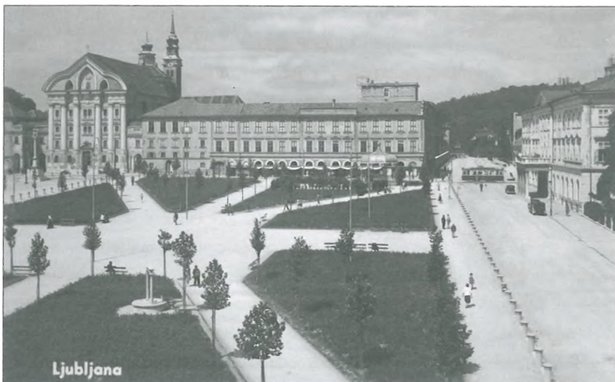
Park Zvezda pred drugo svetovno vojno