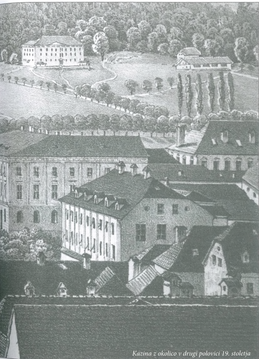
Kazina z okolico v drugi polovici 19. stoletja