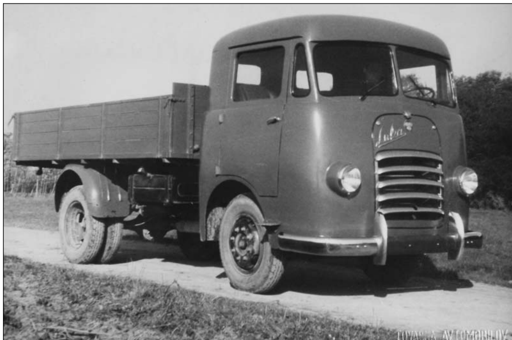
Slika 3: Prvi avtobusi Pionir

Želja po proizvodnji avtobusov se je porodila že leta 1948, ko so kot vzorec za razvoj dobili iz IM v Rakovici prvi kompleten avtobus iz Češke. Glavna direkcija je TAM-u konec leta 1949 poslala načrte za predelavo šasij tovornjaka Pionir v avtobusne šasije. Treba je bilo podaljšati šasijo, sprednji del predelati tako, da dobi jarem za karoserijo; krmilo, ročno zavoro, pedale in menjalno ročico je bilo treba prestaviti naprej. Prve šasije so odpremili v Avtokaroserijo Košaki in Karoserijo Ljubljana (Avtomonta-