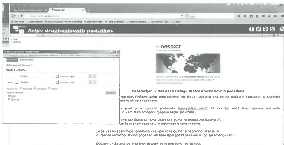
Slika 1: Možnost naprednega iskanja znotraj kataloga ADP.

Pri iskanju podatkov za določen namen si lahko pomagamo s spletnim katalogom. 18 Podatki različnih raziskav, ki so na voljo, so dokumentirani v elektronski obliki. Poleg samega opisa raziskave in njene metodologije so anketni podatki opisani tudi na ravni posameznih spremenljivk v datoteki. Najbolj podrobno raven opisa spremenljivk predstavlja polno besedilo vprašanja in pripadajočih mogočih odgovorov, kakor se je pojavilo v vprašalniku. Lahko si pomagamo tudi s povzetkom in predmetnimi oznakami, ki pa so manj podrobne. Če imamo jasno predstavo o temi, ki nas zanima, kot denimo v našem primeru, ko želimo izvedeti, kakšne podatke imamo na voljo za analizo odnosa do mednarodnih ustanov, lahko tako iščemo z možnostjo »zahtevnega iskanja«, kjer nam seznam zadetkov izlušči, pri katerih spremenljivkah se v besedilu vprašanja pojavljajo posamezne besede in njihove kombinacije (Slika 1).